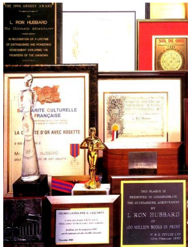
Вверху - некоторые из тысяч наград Л. Рона Хаббарда.